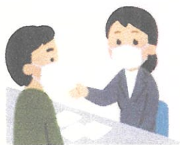
来館にてのご相談