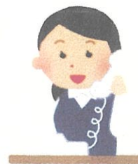
お電話にてのご相談