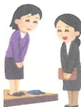
お伺いしてのご相談