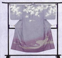
日本の春をやさしく描いた京友禅の仏衣。

最期のお召し物にふさわしい仏衣。 常識を取り払った総柄の仏衣や、着物仕立ての縫製など、 最期のお召し物として、その人を輝かせることができる仏衣。