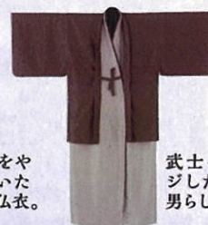
武士をイメージした力強く、男らしい仏衣。