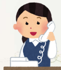
お電話にてのご相談