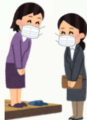
お伺いしてのご相談