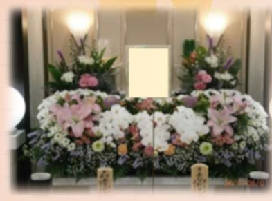
プラス5万円 (税別) で花祭壇