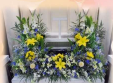
プラス2万円 (税別) で花祭壇