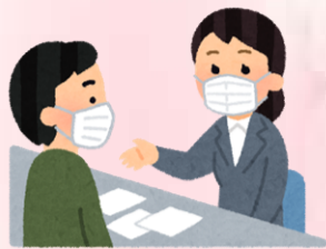
来館にてのご相談